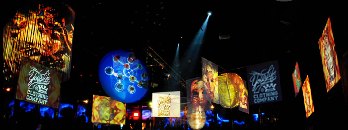
Visuales, logotipos y sonido personalizado para el evento