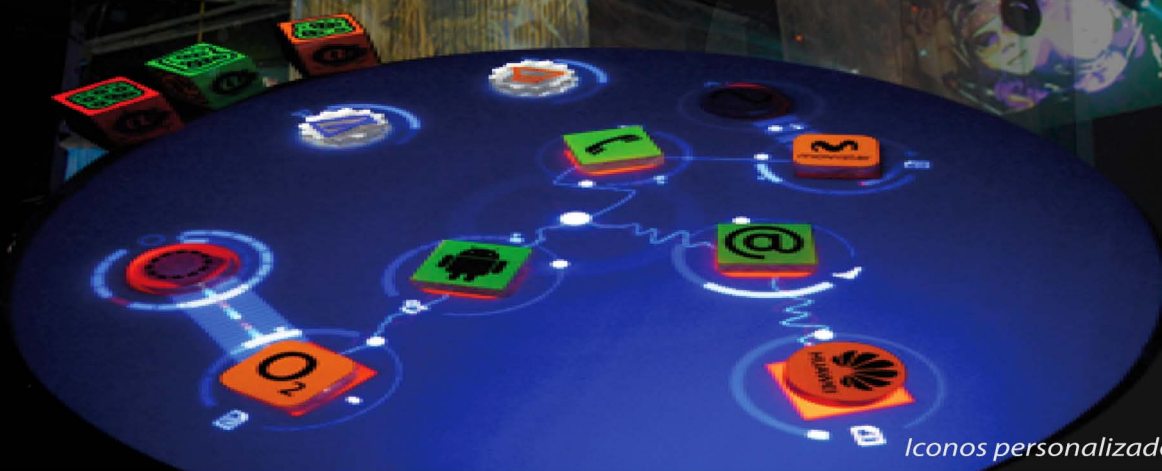
Iconos personalizados para el evento