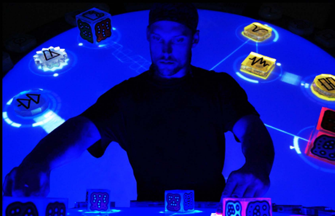
Audiometrage en directo