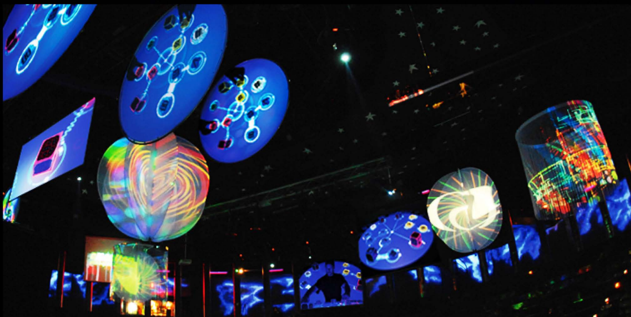
Audiometrage en directo con equipo de visuales